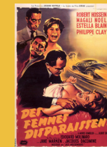
DES FEMMES DISPARAISSENT (A film by Édouard Molinaro)

Lee Morgan (trumpet), Benny Golson (tenor sax), Bobby Timmons (piano), Jymie Merritt (bass), Art Blakey (drums).