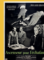
ASCENSEUR POUR L'ÉCHAFAUD (A film by Louis Malle)

23. GÉNÉRIQUE / 24. PIERRE ET BÉATRICE / 25. NE CHUCHOTE PAS / 26. MAMBO DANS LA VOITURE / 27. JUSTE POUR EUX SEULS / 28. BLUES POUR DOUDOU / 29. BLUES POUR MARCEL / 30. BLUES POUR VAVA / 31. PASQUIER / 32. LA DIVORCÉE DE LÉO FALL / 33. DES FEMMES DISPARAISSENT / 34. FINAL POUR PIERRE ET BÉATRICE